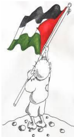
Handala, symbole de la résistance palestinienne

Renvoie le chercheur à sa propre subjectivité