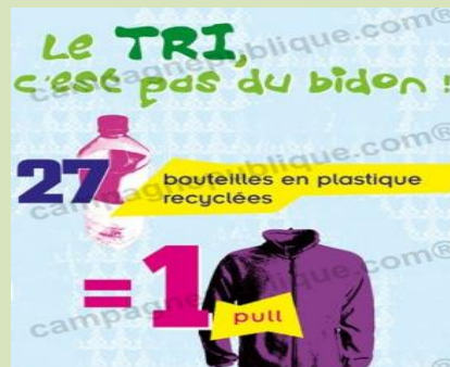
Photo 1: Manque de connaissances sur les conséquences du tri des déchets

Photo 3: https://www.pinterest.fr/explore/poubelle-de-tri/