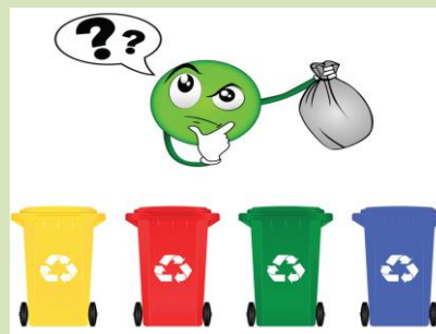
« Ce qui se conçoit bien s'énonce clairement et les mots pour le dire arrivent aisément. »